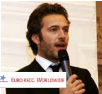
EURO RSCG WORLDWIDE