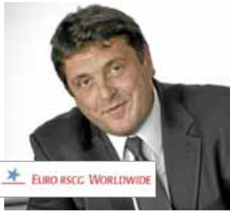
EURO RSCG WORLDWIDE